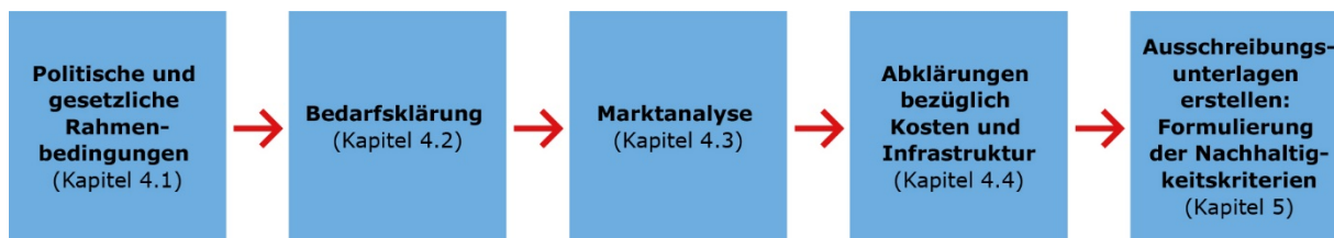
Abbildung 3: Schritte der Überlegungen vor der Beschaffung

Umfassende Informationen zu den Handlungsfeldern der Gemeinden in Bezug auf Elektromobilität: https://www.ebp.ch/de/projekte/leitfaden-elektromobilitaet-fuer-gemeinden